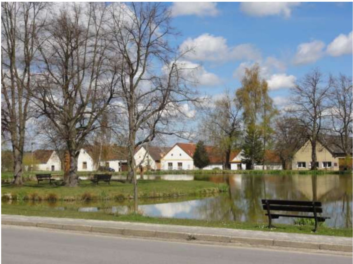
Výhled od „Cepské hospody“

Pro lidi, kteří zde žijí, už jsou tyto věci samozřejmostí. Mnohdy si ani neuvědomují, co vše se v Cepu pro obyvatele i chalupáře dělá. Proto není jistě zbytečné připojit závěrem tuto kratičkou připomínku a přání, aby obec rok od roku stále více rostla do krásy a poskytovala příjemný domov všem, kteří v ní sídlí trvale, nebo si sem jezdí odpočinout po své práci.