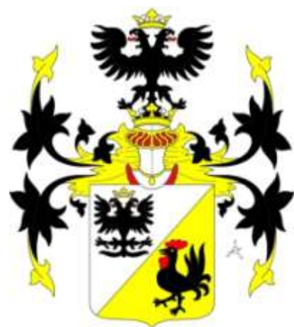
Kořenští z Terešova