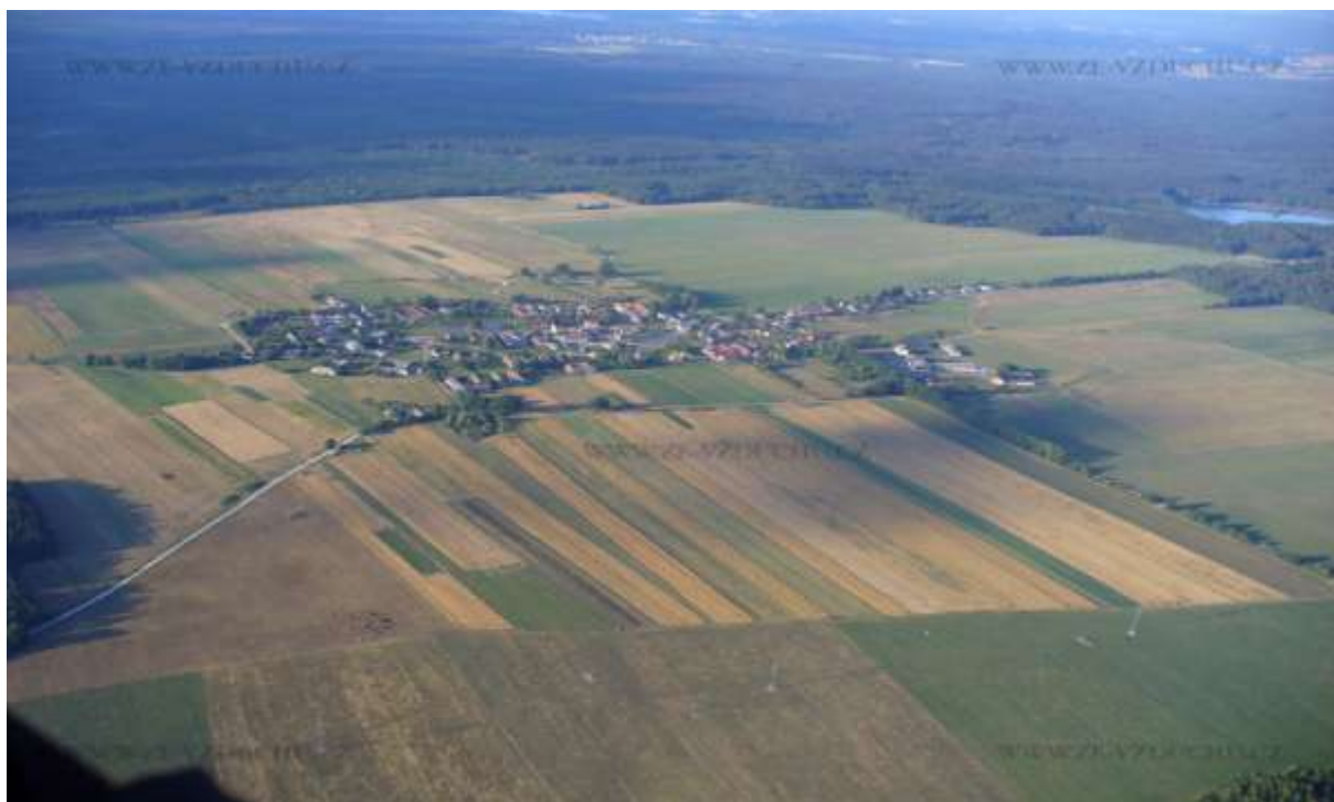
Cep z „ptačí perspektivy“

Rok 2008 uběhl jako voda a je tu rok další. Letmé ohlédnutí za tím starým potvrdí, že naše obec žije, že se v ní stále něco buduje a vylepšuje. Ze všeho je patrné, že to, co se v obci děje má jediný cíl. Plnohodnotný a spokojený život všech obyvatel. Na počátku roku 2009 tedy můžeme předpokládat, že tento trend bude nadále pokračovat, a naše už nyní krásná jihočeská obec bude dále rozkvétat a vytvářet opravdový domov pro své občany.