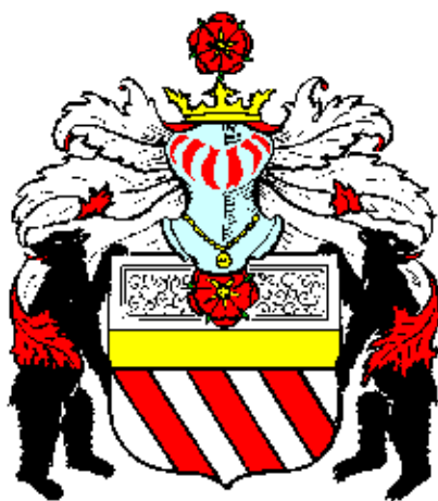
Páni z Rožmberka