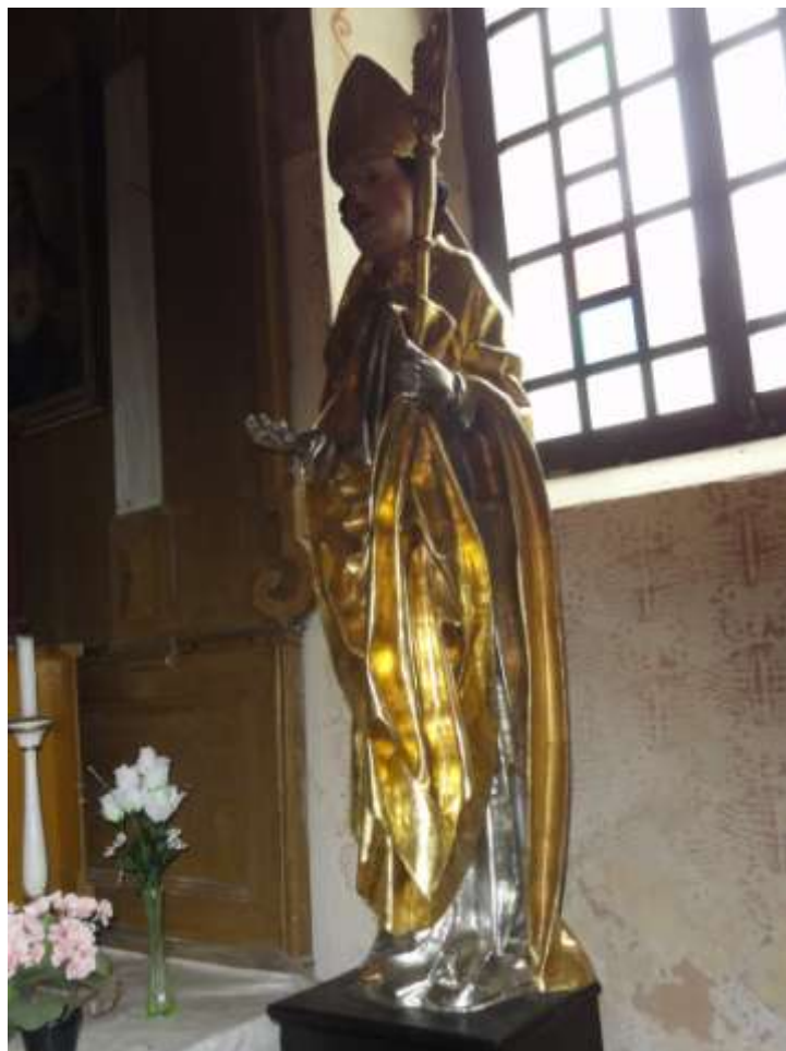
Restaurovaná socha sv. Mikuláše z Myry