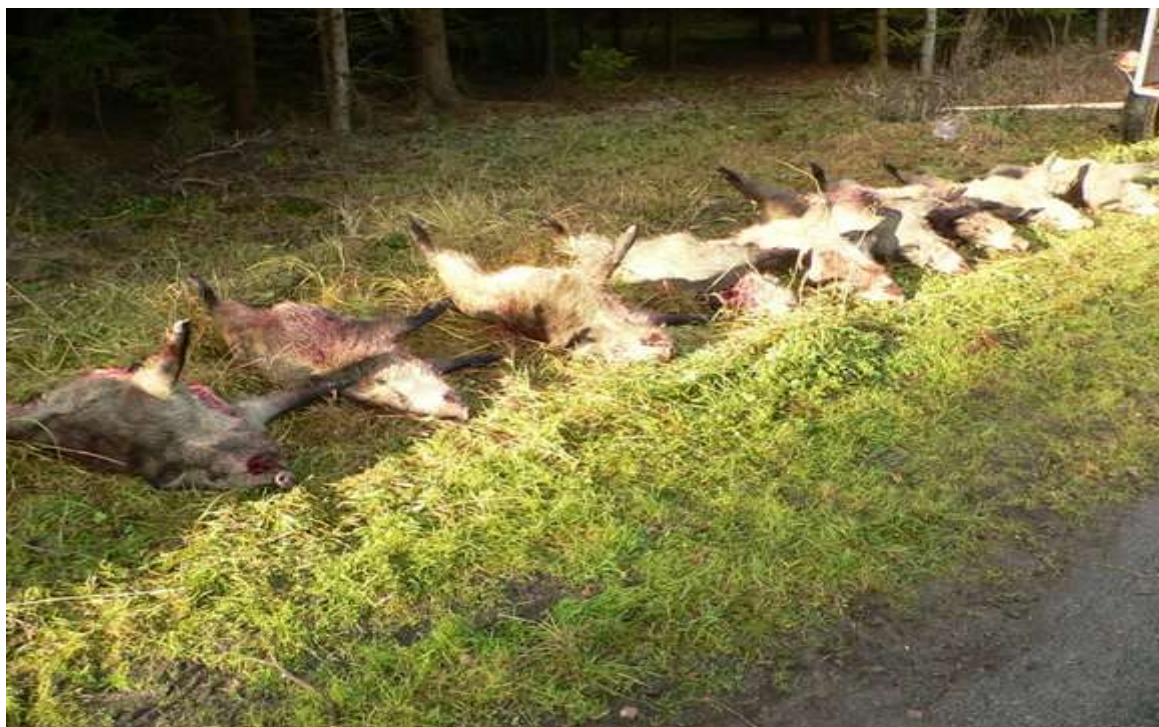
Na snímku z naháňky černé zvěře je výlož letošáků