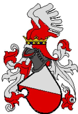
Krajířové z Krajku